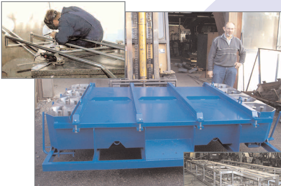
Specialudviklet støbeform til betonpullerter