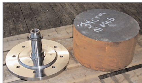
Maskinbearbejdning, nav til maskine med stor belastning, fremstillet af crom nikkel molybdæn stål