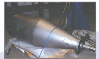
Dobbeltvægget silo til laboratorieindustrien, slebet indvendig med korn 220

Brdr. Paulsen leverer hurtigt og i aftalt kvalitet