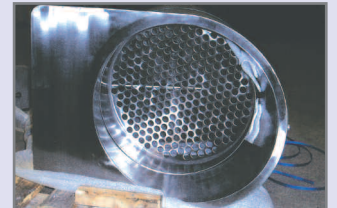
Si til silo til laboratorieindustrien, slebet med korn 220