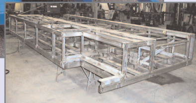
Rustfrit maskinstativ til fyldemaskine, tolerance 1 mm

Produktionen foregår på 1.700 m 2 produktionsareal, hvor vi har en moderne, alsidig og specialiseret maskinpark. Vi går i tæt samarbejde med kunden og producerer både ud fra kundetegninger samt udvikler og konstruerer sammen med kunden.