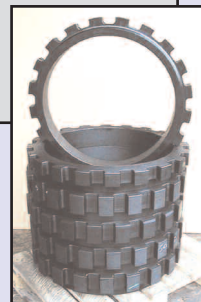
DN 600 bearbejdet i PEH plast

Med vores omfattende maskinpark klarer vi alle opgaver under et tag. Det er derfor ikke nødvendigt at sende emner videre til andre underleverandører. Det sparer tid, og vi har hele tiden styr på, hvor langt produkterne er kommet i processen.