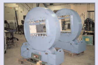
Udvikling af specialmaskine til håndtering af betonbjælker